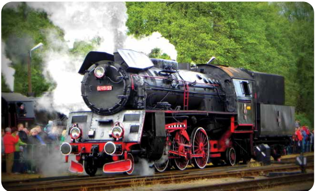
fol. konkurs Parowozowe Impresje

Najdłuższa jest Pt47-65 , licząca 24 metry, a najkrótsza, mała, Tkt48, która mierzy zaledwie 14,2 m. Pt47 to parowóz przeznaczony do prowadzenia pociągów pospiesznych. Cztery osie napędowe i 2000 KM pozwalają osiągnąć mu prędkość do 110 km/h. Posiada on automatyczny podajnik węgla i mieszczący 27 m 3 wody tender.