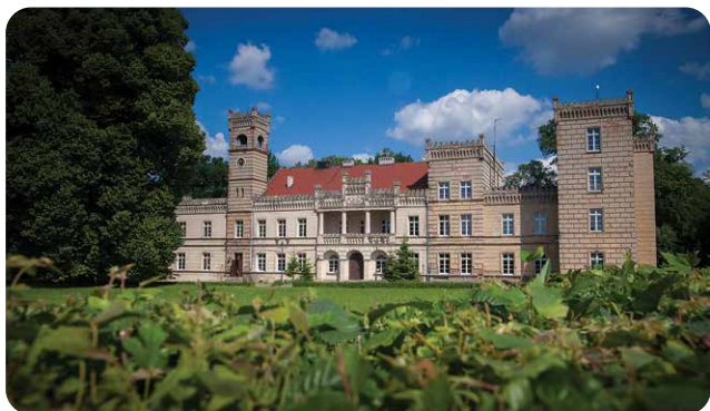
fol. Aleksander Zukowski